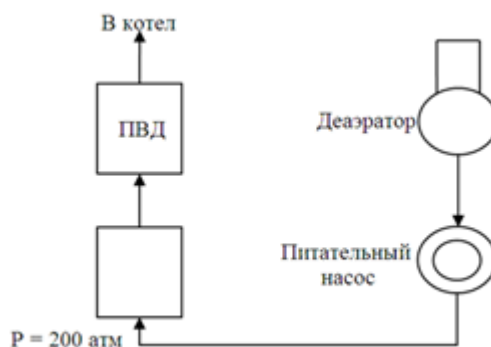
Рис. 1. Принципиальная схема включения питательного насоса

Питательный насос приводится в движение с помощью асинхронного двигателя типа 4АЗМП-4000/60004ХЛ4 со следующими номинальными техническими данными: P = 4000 кВт, напряжение U = 6000 В, ток статора I_1 = 444 А, n_H = 2982 об/мин, , перегрузочная способность по моменту b_H = 2,2 , пусковой момент, b_p = 1,0 .