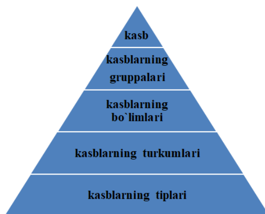
1- rasm. Kasblar klassifikatsiyasini ko`rsatuvchi sxema

Mehnat predmetiga qarab barcha kasblar beshta tipga bo`linadi.