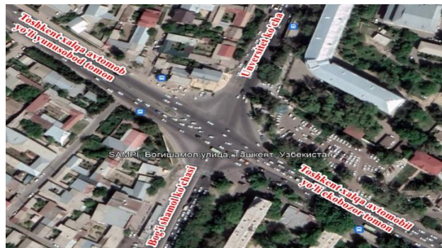
1-rasm Toshkent xalqa avtomobil yo'li, Unversitet ko'chasi va Bog'ishamol ko'chasining kesishmasi joriy holatdagi ko'rinishi.

Tadqiqot obyekti sifatida tanlab olingan chorraha Unversitet ko'chasi, Bog'ishamol va Toshkent xalqa avtomobil yo'li kesishmasi. Chorrahaning umumiy malumotlar quyida keltirilgan. Unversitet ko'chasining umumiy tasmalar soni 5 ta, xar bir ko'cha ajratuvchi bo'laklar bilan jihozlangan, piyodalar o'tish joyi bilan jihozlangan, ko'chaning umumiy eni 21 metr, Bog'ishamol ko'chasining umumiy tasmalar soni 6 ta, ajratuvchi bo'lak bilan jihozlangan, yer usti piyodalar o'tish joyi mavjud, ko'chaning umumiy eni 25 metr, Toshkent xalqa yo'lining umumiy tasmalar soni 5 ta, bo'gan ajratuvchi tasma bilan jihozlangan, ushbu yo'lining ekobozor tarafdin enining uzunligi 22 metr yunusobod tomondan esa 27 metrni tashkil etadi. Chorrahaga o'rnatilgan svetafor 2 fazali, sikl davomiyligi 98 soniya. Ushbu chorraha eng muammoli chorrahalar sirasiga kiradi.