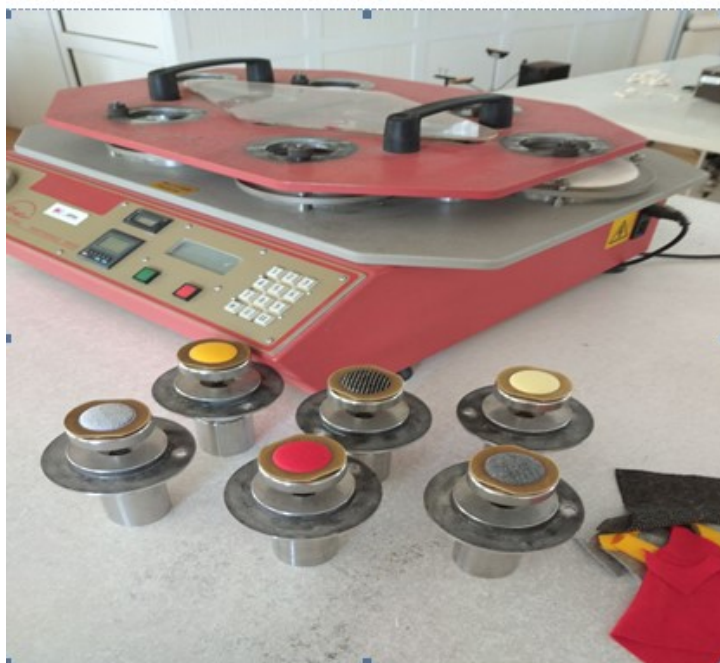
Рис. 1. Подготовка и испытания образцов на устойчивость к истиранию на приборе М 235/3

Для изучения свойства трикотажа у отобранных образцов были определены структурные и физические показатели при помощи современного оборудования Учебно- Испытательной лаборатории при Ташкентский институт текстильной и легкой промышленности, регламентированные в общем техническом регламенте «О Безопасности продукции лёгкой промышленности».