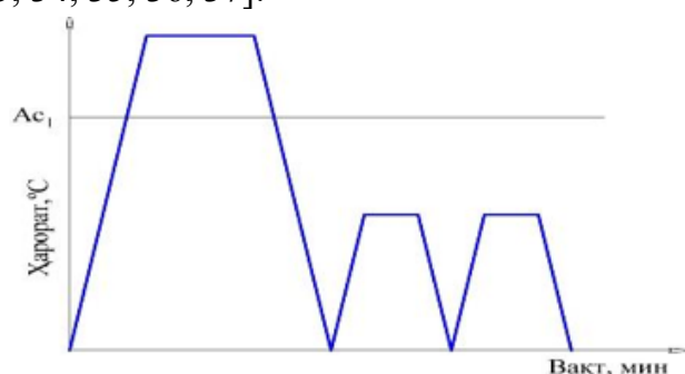
2-рис. Схема завершения термической обработки

Процесс последнего термического обработки для литых изделий включает нагревание до стандартной температуры отжига для каждой марки литого металла и охлаждение в среде водного полимера на основе препарата "Унифлок". Для литого металла марки У10 процесс нагревания проводился при температуре от 400°C до 500°C в импульсном режиме. Время нагревания было выбрано исходя из необходимости достижения нужной температуры и составило от 10 до 15 минут. Далее производился процесс охлаждения в среде водного полимера на основе препарата "Унифлок". Рекомендуемые схемы последней термической обработки изображены на рисунке 2.2 [27, 28, 29, 30, 31, 32, 33, 34, 35, 36, 37].