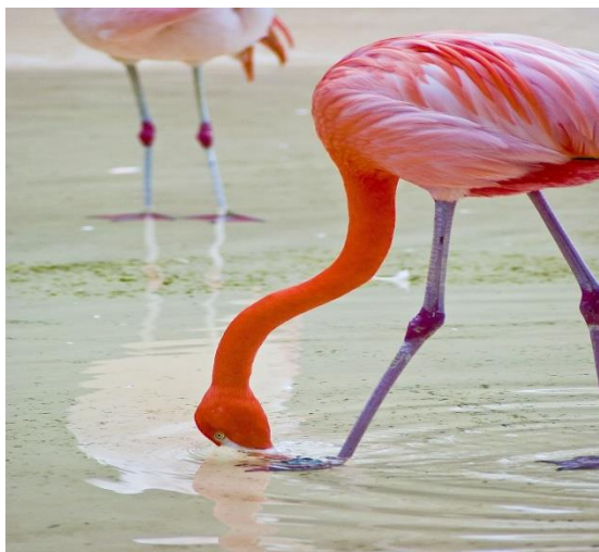
3–rasm. Flamingoning oziqlanishi