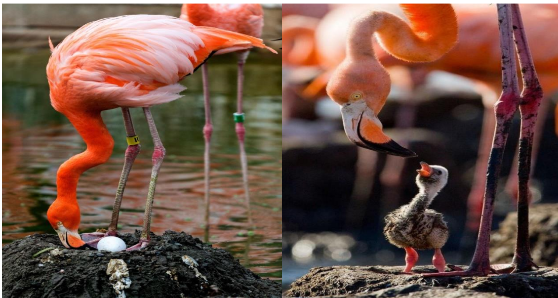
2–rasm. Flamingo uyasi va bolasining ko'rinishi

Dengiz va sho'r ko'l qirg'oqlariga koloniya bo'lib (ba'zan bir necha mingtasi birga) uya quradi. Konussimon, balandligi 10—60 sm li uyasini balchiq yoki qumdan yasaydi. 1–2 ta tuxum qo'yadi. Tuxumini nari va modasi navbat bilan 30–32 kun bosadi. Jo'ja ochuvchi qushlardan hisoblanadi. Polaponlari parli, ko'zlari ochiq. Polaponlari tug'ilgandan so'ng inlarida 5–12 hafta qoladilar. Polaponlari ota - onalari ularni boshlang'ich paytlarida substantsiyalar va o'zlarining oshqozonlarining tepa qismlaridagi hazm bo'ladigan moddalar bilan oziqlantirishadi. Flamingo polaponchalari kuchga kirganlaridan so'ng "yasli" deb ataladigan guruhlarda mustaqil ovqatlanishni o'rganishni boshlashadi (2-rasm).