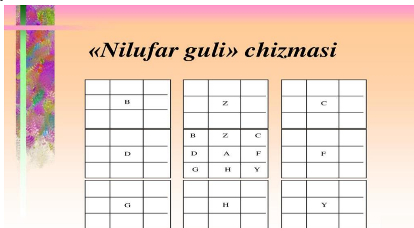
2 – rasm.

"Nilufar guli" metodidan foydalanish o'quvchini tizimli fikrlash, tahlil qilish ko'nikmalarini rivojlantiradi va faollashtiradi.