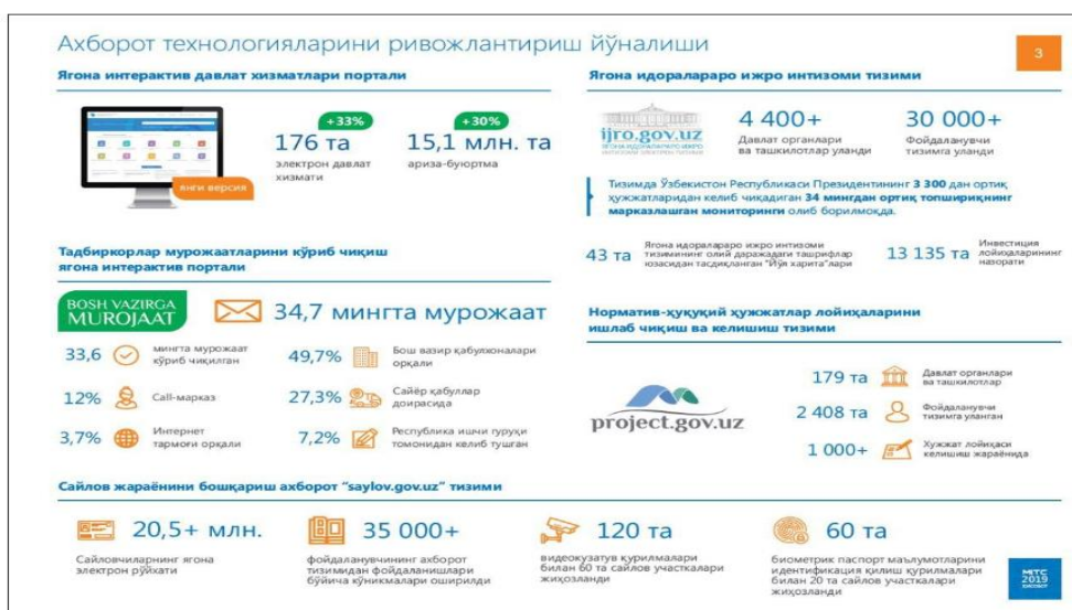
3-rasm. Axborot texnologiyalarini rivojlantirish yo'nalishi. 25

AKT sohasida 2020 yilda muhim ijtimoiy loyiha amalga oshirildi. Xitoy kompaniyasi bilan umumiy qiymati 11,8 million dollar miqdorida shartnoma imzolanib, Toshkent tibbiyot xodimlariga zamonaviy AKT va tibbiy asbob-uskunalar bilan jihozlangan 150 dona tez tibbiy yordam avtomobillari (reanimobil) yetkazib berildi va avtomatlashtirilgan tez tibbiy yordam xizmati boshqaruv tizimi joriy etildi. Axborot-kommunikatsiya texnologiyalarining izchil rivojlanishining yana bir muhim omillaridan biri sohada raqobatbardosh mahsulotlar va xizmatlarni rivojlantirish uchun qulay shart-sharoitlar yaratish, ularni ichki va tashqi bozorlarda ilgari surish, innovatsion ishlanmalarni rag'batlantirishdir. Telekommunikatsiya infratuzilmasini yanada rivojlantirish maqsadida yil yakuniga qadar 153,7 million dollar miqdoridagi loyihalarni amalga oshirish belgilangan. Shu kunga qadar asosan telefon xizmatlarini ko'rsatuvchi 2G mobil tarmoqlarni kengaytirish vazifasi bajarilgan bo'lsa, hozir tarmoqning qamrovini oshirish bo'yicha loyihalar 3G/4G tarmoqlarini kengaytirishga yo'naltirilmoqda. Xususan, shu yilning o'zida 3 012 ta 2G baza stansiyalar 3G/4G standartiga modernizatsiya qilindi va 2 933 ga yaqin yangi baza stansiyalar o'rnatilib ishga tushirildi.