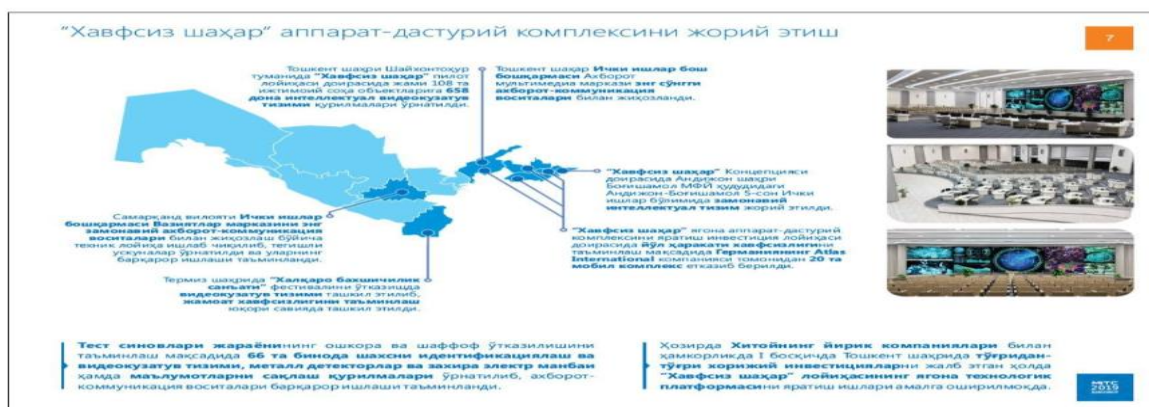
4-rasm. “Xavfsiz shahar” apparat-dasturiy kompleksi. 26

AKT sohasida 2020 yilda muhim ijtimoiy loyiha amalga oshirildi. Xitoy kompaniyasi bilan umumiy qiymati 11,8 million dollar miqdorida shartnoma imzolanib, Toshkent tibbiyot xodimlariga zamonaviy AKT va tibbiy asbob-uskunalar bilan jihozlangan 150 dona tez tibbiy yordam avtomobillari (reanimobil) yetkazib berildi va avtomatlashtirilgan tez tibbiy yordam xizmati boshqaruv tizimi joriy etildi. Axborot-kommunikatsiya texnologiyalarining izchil rivojlanishining yana bir muhim omillaridan biri sohada raqobatbardosh mahsulotlar va xizmatlarni rivojlantirish uchun qulay shart-sharoitlar yaratish, ularni ichki va tashqi bozorlarda ilgari surish, innovatsion ishlanmalarni rag'batlantirishdir. Telekommunikatsiya infratuzilmasini yanada rivojlantirish maqsadida yil yakuniga qadar 153,7 million dollar miqdoridagi loyihalarni amalga oshirish belgilangan. Shu kunga qadar asosan telefon xizmatlarini ko'rsatuvchi 2G mobil tarmoqlarni kengaytirish vazifasi bajarilgan bo'lsa, hozir tarmoqning qamrovini oshirish bo'yicha loyihalar 3G/4G tarmoqlarini kengaytirishga yo'naltirilmoqda. Xususan, shu yilning o'zida 3 012 ta 2G baza stansiyalar 3G/4G standartiga modernizatsiya qilindi va 2 933 ga yaqin yangi baza stansiyalar o'rnatilib ishga tushirildi.