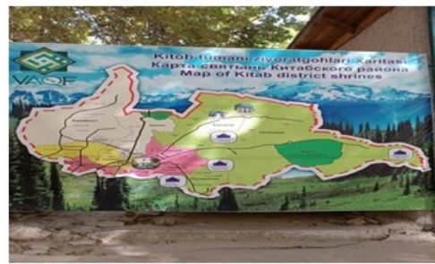
2-rasm H.Bashir Ziyoratgohi (Chapda) va ushbu yerdagi Tuman hududidagi ziyoratgohlar kartasi

Bashir qishlog'idan 7 km janubda mashhur Varganza qishlog'i joylashgan. Varganza – birinchi agroturizm qishlog'idir. Bu yerda O'zbekistonda birinchi marta "Anor" xalqaro agroturizm festivali o'tkazildi. Festivalda 23 mamlakat qatnashdi, qishloq esa agroturizm qishlog'i maqomiga ega bo'ldi. Varganza yurimizda anor yetishtirish bo'yicha Quva (Farg'ona) va Dashnobod (Surxondaryo)dan keyin 3-yirik markaz hisoblanadi.