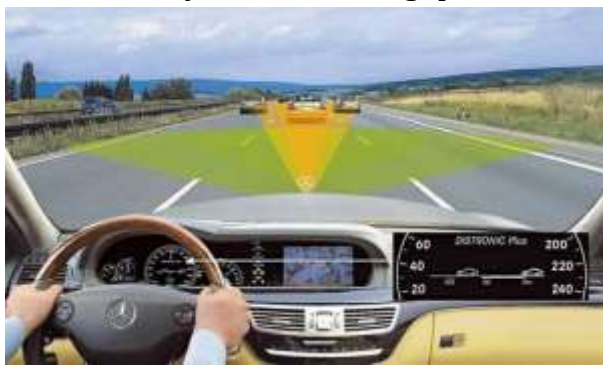
2.2.2-rasm. Kruiz nazorati tizimining ishlashi.

ishlashi (tezlikni belgilash, uni pasaytirish yoki oshirish) haydovchi avtomashinani kerakli tezlikka ko'targandan so'ng, rul ustunidagi tugmachani yoki rulni tugmachalarini bosib amalga oshiradi. Haydovchi tormoz yoki gaz pedalini bosganda tizim bir zumda o'chiriladi. Kruiz nazorati uzoq safarlarda haydovchining charchashini oyoqlarning bo'shashishiga imkon berish orqali sezilarli darajada kamaytiradi. Ko'pgina hollarda, kruiz nazorati dvigatelning barqaror ishlashini ta'minlash orqali yonilg'i sarfini kamaytiradi; dvigatelning ishlash muddati oshadi, chunki tizim tomonidan doimiy tezlikda uning qismlarida o'zgaruvchan yuk bo'lmaydi.[19]