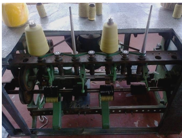
Рис.1. Устройство для кручения пряжи

По результатам проведенных теоретических исследований [1] авторами [2], [5] изготовлено устройство для кручения пряжи [3] (Рис.1.) и проведены предварительные эксперименты [16].