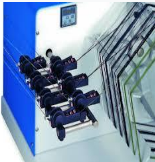
Характеристики машин двойной скрутки